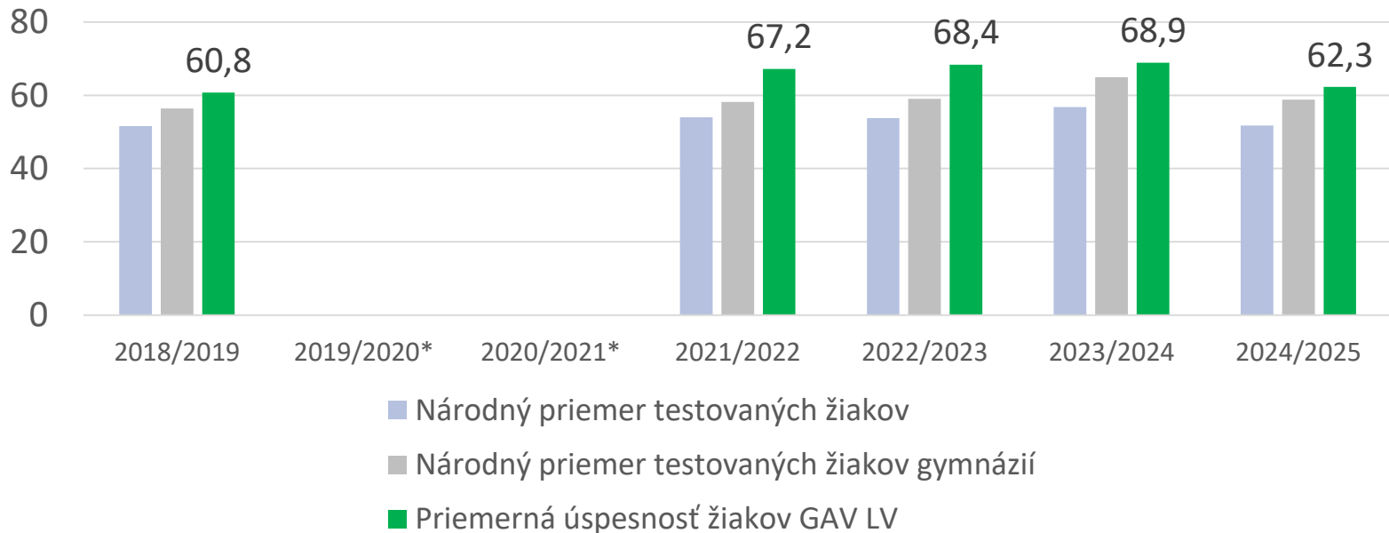
Vývoj úspešnosti žiakov v EČ MS z MAT v rokoch 2019 až 2025 (v %)

Priemerná úspešnosť našich žiakov: 62,3 % (38 žiakov)