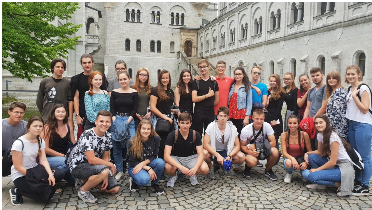
Mníchov – jún 2018