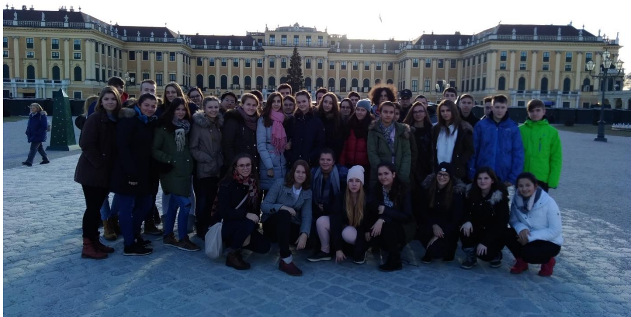
Schloss Hof – jún 2017