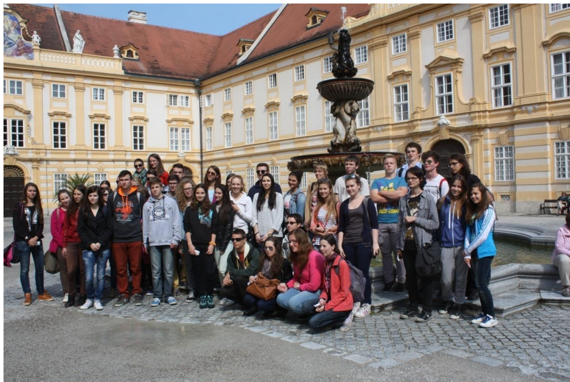
Innsbruck – jún 2014